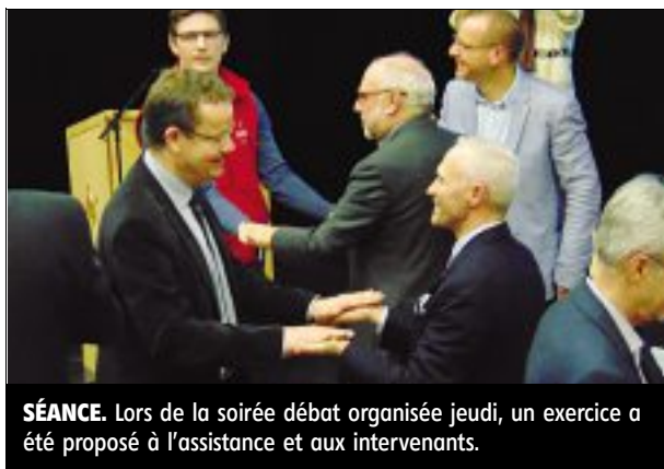
SÉANCE. Lors de la soirée débat organisée jeudi, un exercice a été proposé à l'assistance et aux intervenants.

La soirée débat sur le thème du sport chez les seniors a fait le plein jeudi soir à l'espace culturel Lionel-Boutrouche.