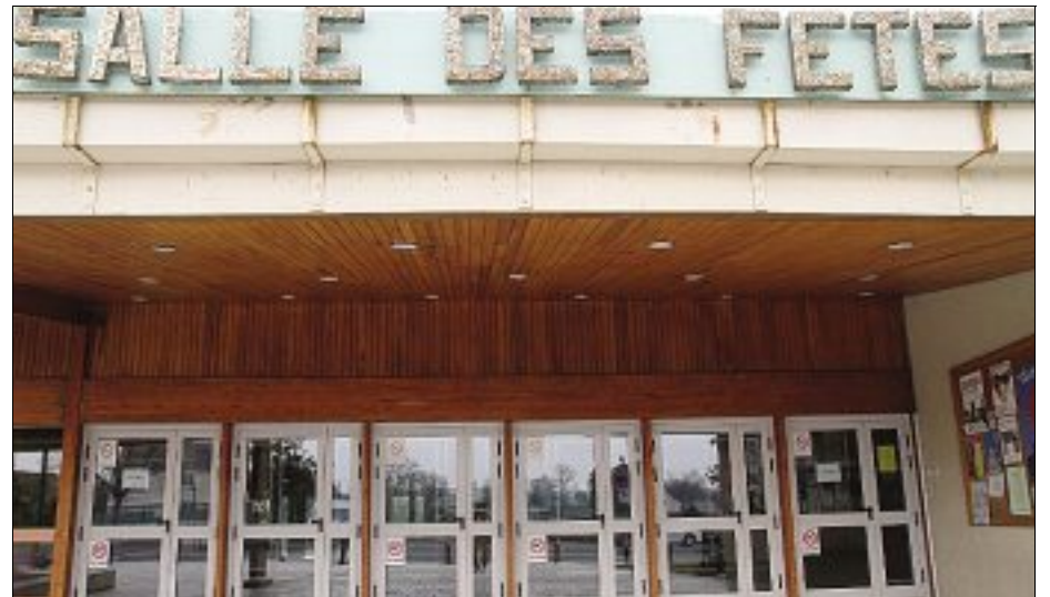
RÉNOVATION. Les projets annoncés par le maire devraient aboutir dans plusieurs mois. La totalité de la saison 2016-2017 aura donc lieu dans la salle actuelle.