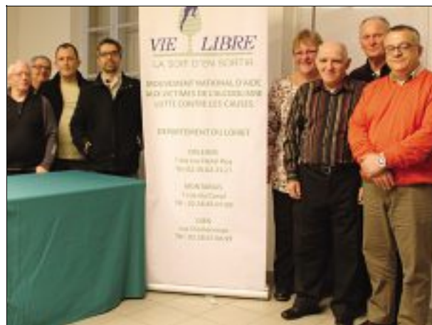
ASSEMBLÉE GÉNÉRALE. Le comité de gestion de la section orléanaise Vie Libre est passé de 5 à 9 membres.

La section d'Orléans de l'association Vie Libre (aide aux victimes de l'alcool) tenait en fin de semaine son assemblée générale à la salle municipale de la guinguette.